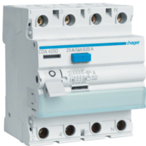
Proudový chránič 4 pól. 25A / 0,03 A, typ A, 6 kA