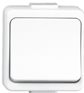
GXNP001, GXNP003, GXNP004, GXNP005, GXNP006